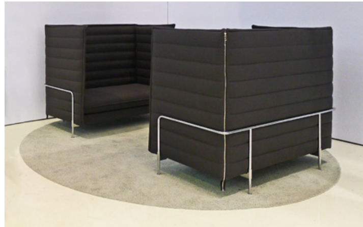
Tube 2018 (9 x 5 m)